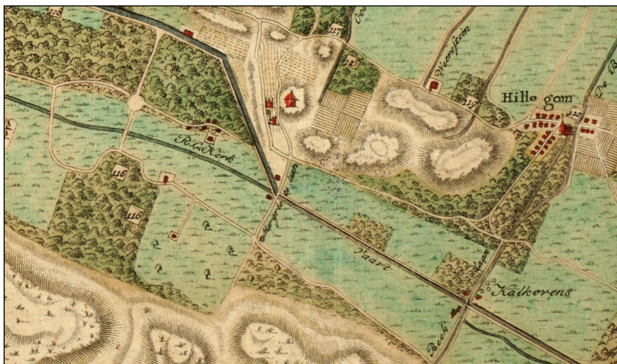
Detail uit de kaart van Gt. van der Paauw uit 1805. Rechtsonder staan de kalkovens nog aangegeven en daar tegenover zien we nog een huis staan, dat waarschijnlijk van Cornelis van Opzeeland is geweest