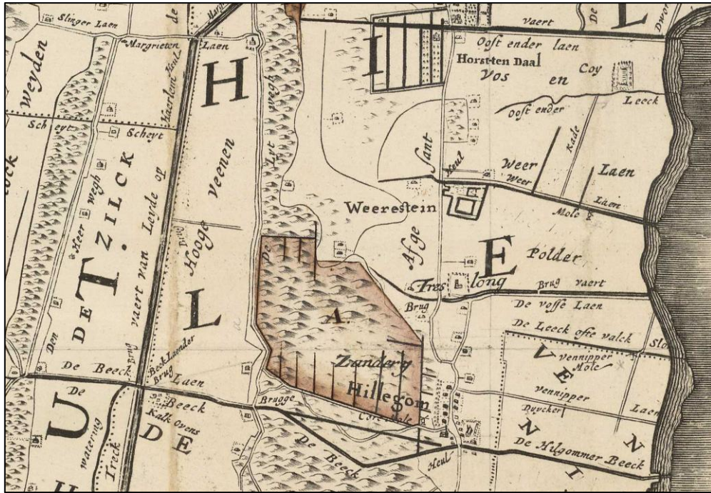
Gedeelte van de kaart van het ambacht Hillegom met de Beeklaan en de Leidsevaart, 1746 Linksonder zien we bij de kruising van de Beeklaan en de Leidsevaart ook de kalkovens liggen, die vermeld worden in de doopakten vanaf 28 januari 1777. Cornelis van Opzeeland woonde daar sinds 1774 tegenover aan de noordzijde van de Beeklaan op het land Hooge Veenen, dat van hem was.